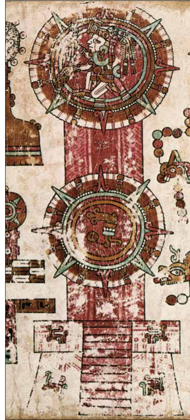
Figura 6.4. Discos solares en el códice de Viena, p. 23; Österreichische Nationalbibliothek (Biblioteca Nacional de Austria), Viena.

Aunque muy alejados en tiempo y espacio, existen paralelos significativos en las fuentes mixtecas del período Postclásico en Oaxaca, México, así como en regiones culturales próximas, algunas de ellas hablantes de náhuatl, en tanto que otras se extienden hasta las tierras altas de Guatemala (Chinchilla Mazariégoz, 2013; Díaz Balsera, 2008; Jansen, 1997). En estas áreas, el nacimiento de nuevas dinastías se fundía con imágenes de soles nacientes, tiempos de oscuridad ahora iluminados por lenguas de fuego. Algunos de estos soles levitaban sobre templos sangrientos. En la página 23 del códice de Viena, por ejemplo, hay discos solares que se alzan, dejando un