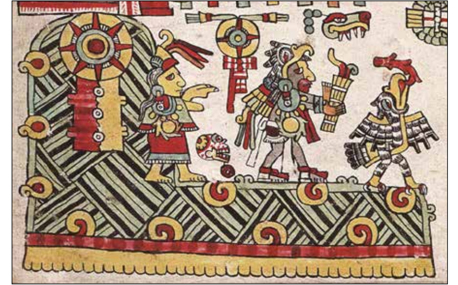
Figura 6.5. Discos solares emergentes en el códice Nuttall, p. 21; Museo Británico. Fotografía: Trustees for the British Museum, ET Am1902, 0308.1, Add. Mss. 39671.

rastro de sangre, a partir de un edificio humeante marcado con rayas rojas (Figura 6.4; Anders et al. , 1992: 148; Boone, 2000: 90, 94; Furst, 1978: 216, 219-220). Uno de estos discos incluso lleva el signo del día 1 Flor, el mismo nombre, quizá no por coincidencia, utilizado por “1 Ajaw [Flor],” uno de los Gemelos Heroicos de los mayas del período Clásico, quien es el prototipo del gobernante. El otro disco del códice de Viena muestra al Dios Solar de los mixtecos. El códice enfatiza además el papel de las parejas creadoras, un patrón que recuerda al par que aparece en la crestería del Templo del Sol Nocturno (Boone 2000: 91-92, fig. 47).