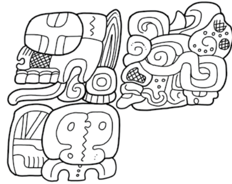
Figura 6.3. Estela 31 de Tikal (G5-G6). Dibujo: Stephen Houston.

Aunque muy alejados en tiempo y espacio, existen paralelos significativos en las fuentes mixtecas del período Postclásico en Oaxaca, México, así como en regiones culturales próximas, algunas de ellas hablantes de náhuatl, en tanto que otras se extienden hasta las tierras altas de Guatemala (Chinchilla Mazariégoz, 2013; Díaz Balsera, 2008; Jansen, 1997). En estas áreas, el nacimiento de nuevas dinastías se fundía con imágenes de soles nacientes, tiempos de oscuridad ahora iluminados por lenguas de fuego. Algunos de estos soles levitaban sobre templos sangrientos. En la página 23 del códice de Viena, por ejemplo, hay discos solares que se alzan, dejando un